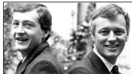
Топ-снукерист 80-х Стив Дэвис и его промоутер Барри Хирн