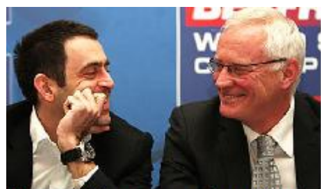
Ронни О'Салливан и Барри Хирн